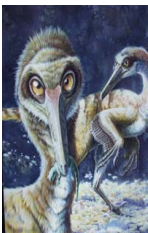
El "Gonzalo" (tapa de la revista Nature, 2005)